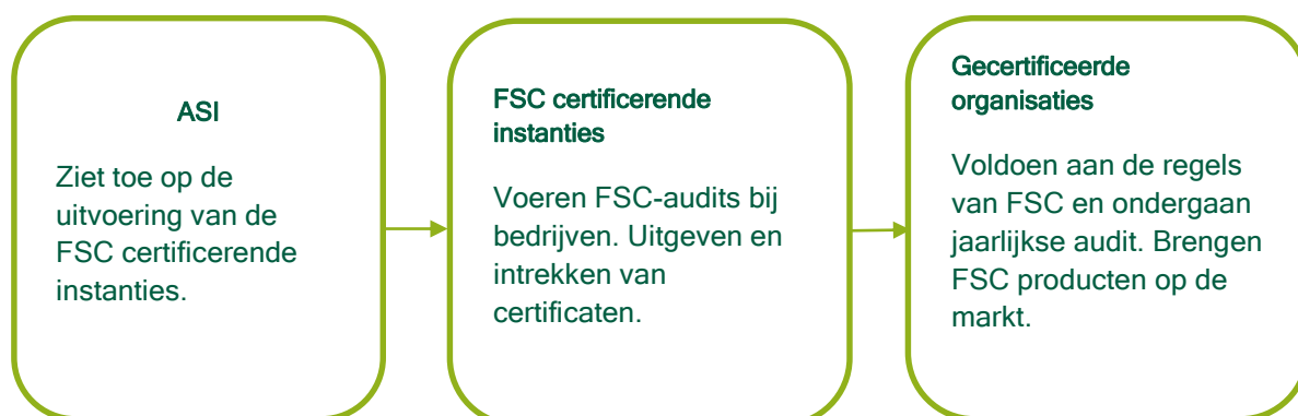
Figuur 1. Het FSC systeem - de belangrijkste spelers en hun rollen