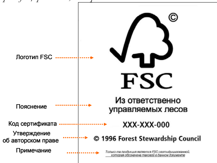
Пример 4. Использование логотипа FSC на счетах-фактурах.